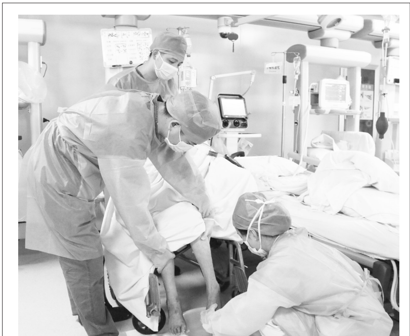
ICU医护人员给病人洗脚泡脚

医院以“互联网+党建+医疗”三方联合的新模式,打造党员先锋、网络先锋、健康先锋,加深红色烙印,传承